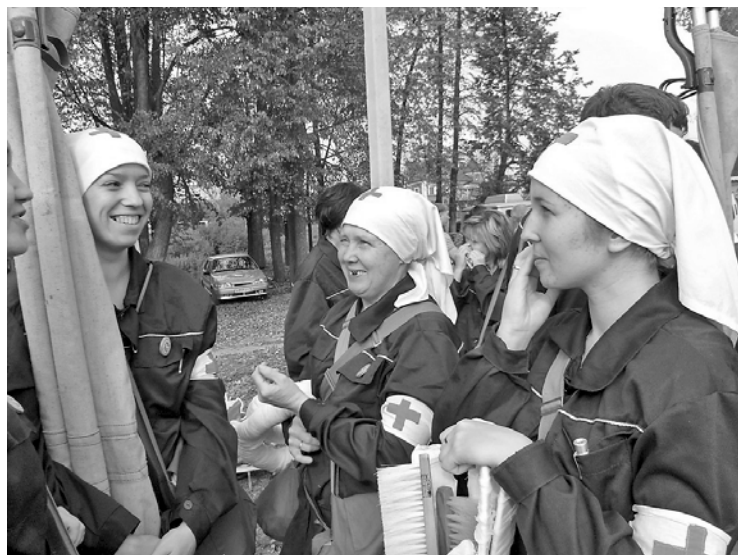
Сандружина Марийского машиностроительного завода

крепляют практические навыки по оказанию первой медицинской помощи в очагах химического, биологического и радиационного поражения.