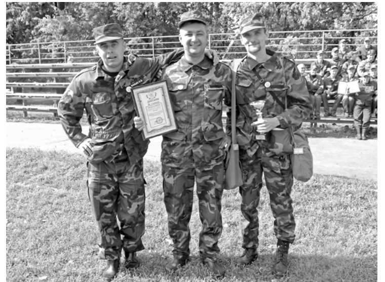
Филиал ОАО «ТГК-5» «Марий Эл и Чувашии»

Состязания проходили в несколько этапов, где предусмотре-