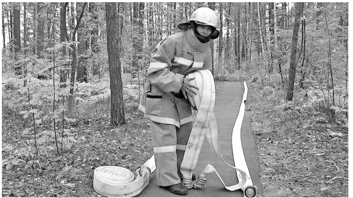
Раскладывание магистральной линии для бесперебойной подачи воды

Прибывают дополнительные силы. К этому времени вода в емкости первой машины уже на исходе, поэтому вторая сразу становится на водосточник — пирс на берегу озера Карась. Для бесперебойной подачи воды прокладывается магистральная линия длиной почти в 200 метров. На