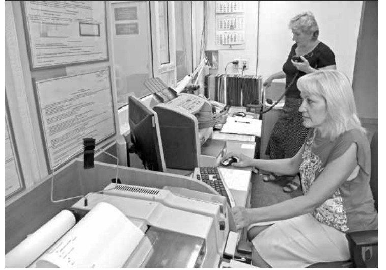
Единая диспетчерская служба Йошкар-Олы

сложно домовладельцам а сделать себе небольшую ливневую канализацию? Поэтому весной их огороды напоминают бассейны, а они звонят нам и жалуются. В основном подтопления территорий происходят из-за природно-климатических условий, но бывают и исключения. Пару лет назад весной Тарханово и часть домов по улице Дружба вдруг затопило. Оказывается, при строительстве частного дома кому-то помешала небольшая речушка Шоя, протекающая в этом районе города. И «народные умельцы» решили изменить ее течение, вырыв новую канаву и нарушив русло реки. В итоге пострадал целый микрорайон. Виню был найден, а реке придан первоначальный вид.