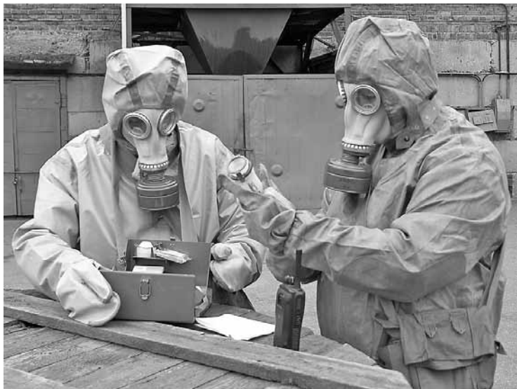
Учения по ГО