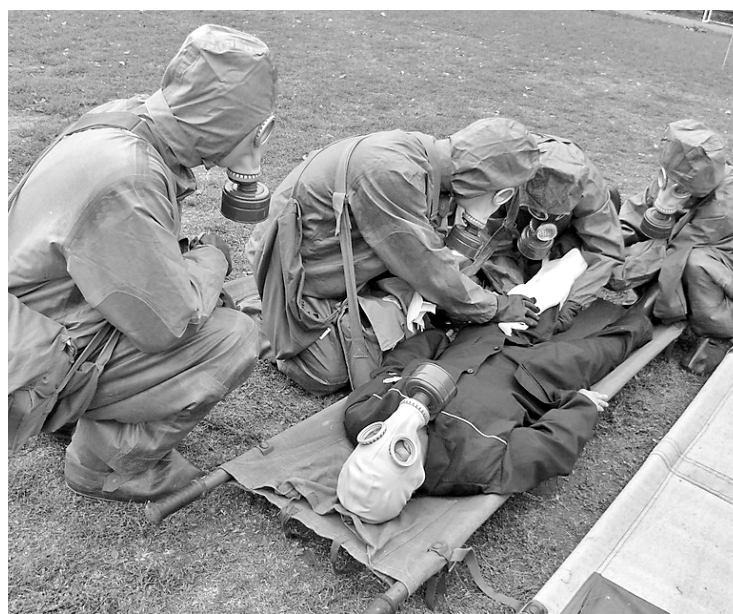
Оказание помощи пострадавшему

Знания команд проверяли специалисты городских поликлиник и больниц, студенты медицинского колледжа, спасатели городской аварийно-спасатель-