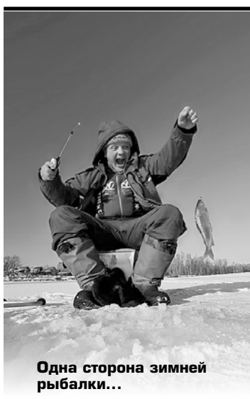
Одна сторона зимней рыбалки...

Нет необходимости пешком в тяжелой одежде и со всем рыбацким скарбом преодолевать большие расстояния по снежному заносам. Нужно помнить, что не везде толщина льда одинакова, есть опасные участки. В Йошкар-Оле нужно быть особо внимательным в районе Ширяйково, там места льда тонкий.