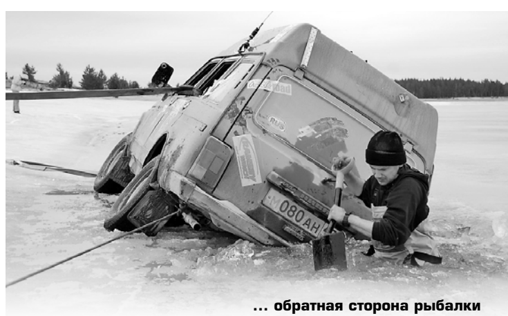
... обратная сторона рыбалки

Сейчас для поездки на водоемы появилось много самой различной техники – снегоходы, мотобуксировщики, вездеходы, квадрациклы, самодельные каракаты. Часто выезжают и на автомобилях. Хотя, на них выезжать на лед запрещено.