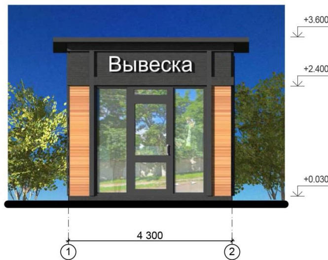
Фасад в осях 1-2