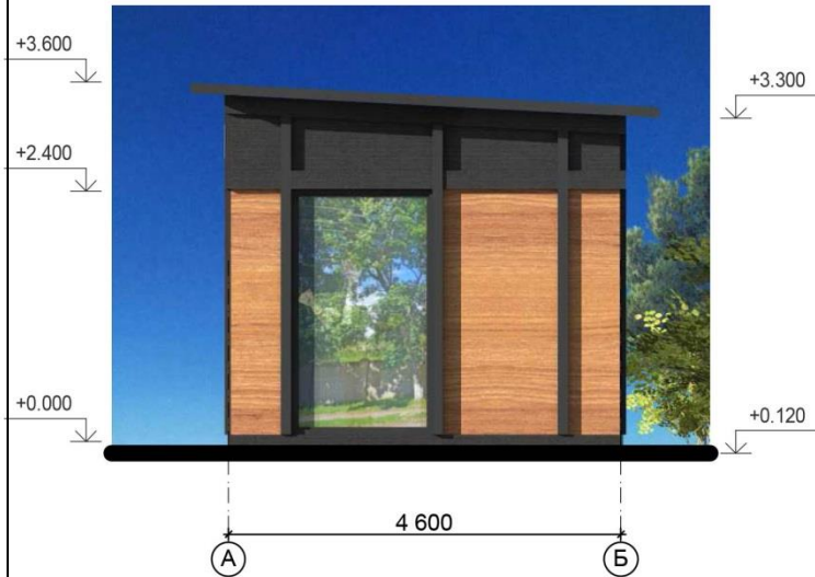
Фасад в осях А-Б