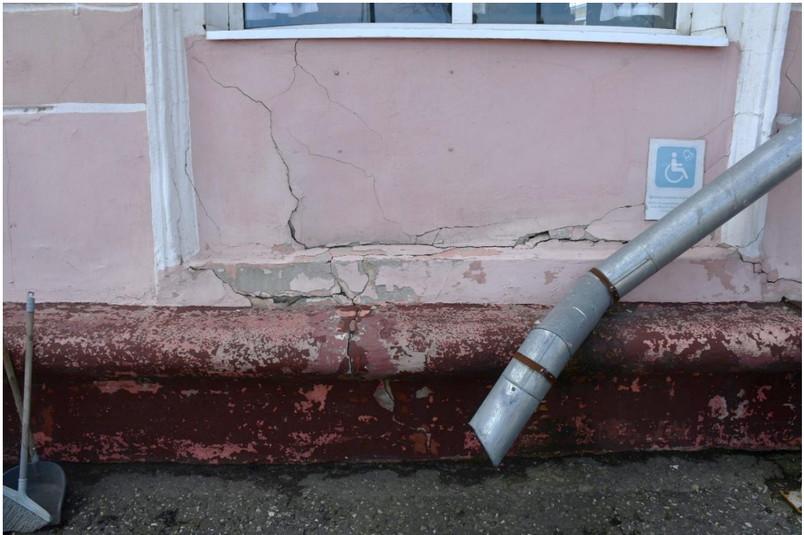
Фото 5. ОКН «Гостиница «Советская», 1960 г.». Фрагмент главного фасада. Наличие трещин в стенах и цоколе, отслоение отделочных слоев.