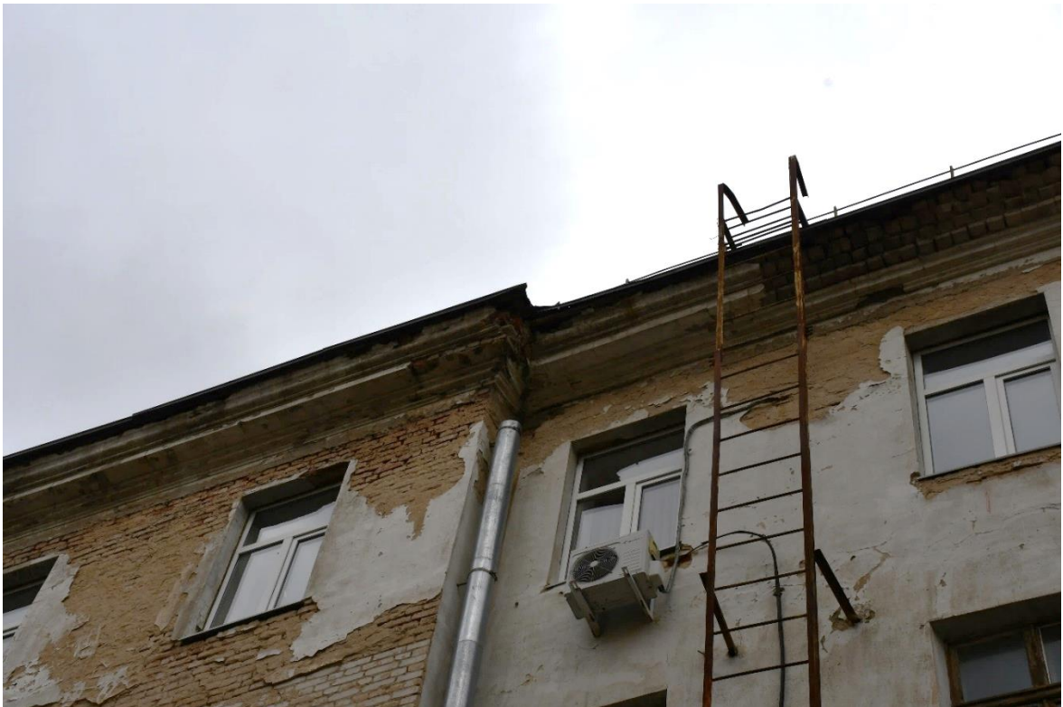
Фото 10. ОКН «Гостиница «Советская», 1960 г.». Фрагмент дворового фасада.

Увлажнение и следы биологического повреждения (мох, растительность) кирпичной кладки, наличие трещин, множественные утраты штукатурного слоя со стороны дворового фасада, отслоение отделочных слоев, вымывание и выветривание связующего раствора кладочных швов, деструкция кирпичной кладки и в местах утрат штукатурного слоя, разрушение и вывалы кладки цоколей дворового фасада, приямки разрушены, частично отсутствуют отметы (сливное колено).