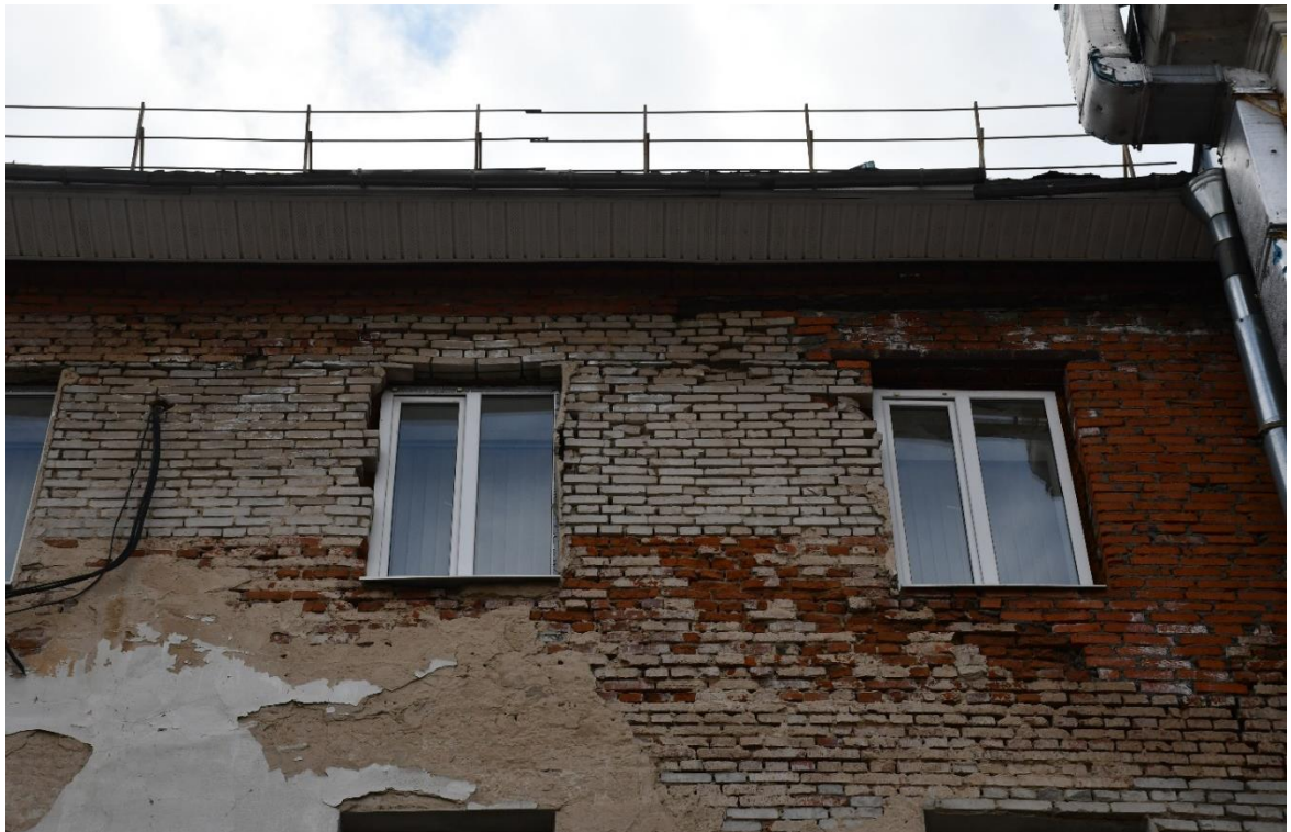
Фото 11. ОКН «Гостиница «Советская», 1960 г.». Фрагмент дворового фасада Наличие вертикальных и наклонных трещин в стенах, множественные утраты штукатурного слоя, вымывание и выветривание связующего раствора кладочных швов, деструкция кирпичной кладки и в местах утрат штукатурного слоя, выпадение отдельных кирпичей, фиксируется наличие поздних ремонтов, заполнения оконных проемов частично заменены на пластиковые.