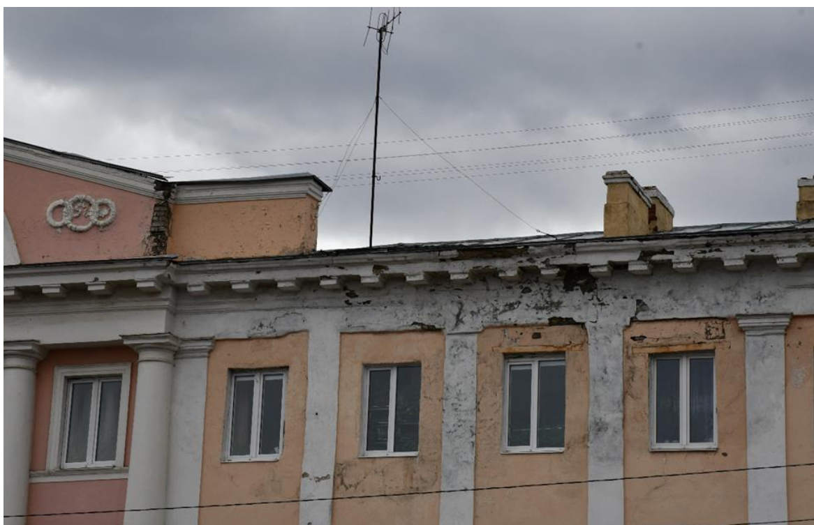
Фото 8. ОКН «Гостиница «Советская», 1960 г.». Фрагмент главного фасада (вид с севера). Неудовлетворительное состояние отделки фасадов, архитектурные элементы имеют утраты, разрушение кирпичной кладки, отслоение штукатурного и окрасочного слоев.