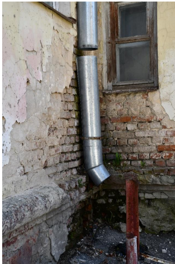
Фото 6. ОКН «Гостиница «Советская», 1960 г.». Фрагмент дворового фасада. Увлажнение и следы биологического повреждения (мох, растительность) кирпичной кладки, множественные утраты штукатурного слоя со стороны дворового фасада, вымывание и выветривание связующего раствора кладочных швов, деструкция кирпичной кладки и в местах утрат штукатурного слоя, разрушение цокольного пояса, прорастание травы на цокольном поясе, отмостка в неудовлетворительном состоянии, разъединение звеньев водосточных труб.