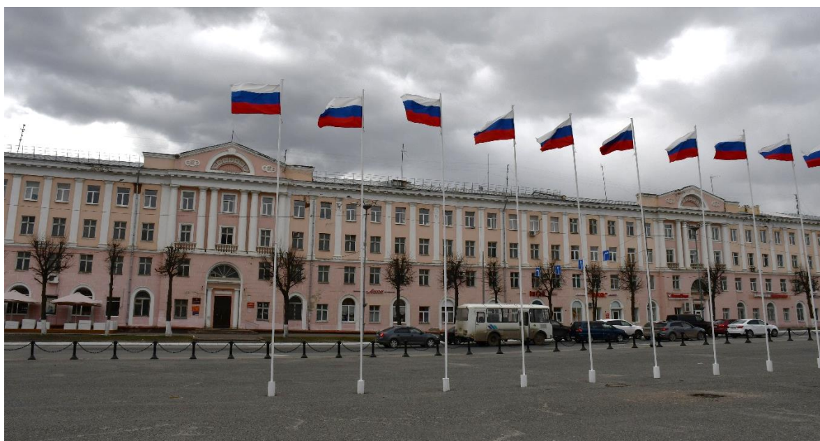
Фото 2 ОКН «Гостиница «Советская», 1960 г.». Вид на объект с севера.

На фасадах установлены сплит-системы кондиционирования без согласования Минкультуры Республики Марий Эл, заполнения оконных проемов частично заменены на пластиковые, отсутствует информационная надпись объекта культурного наследия.