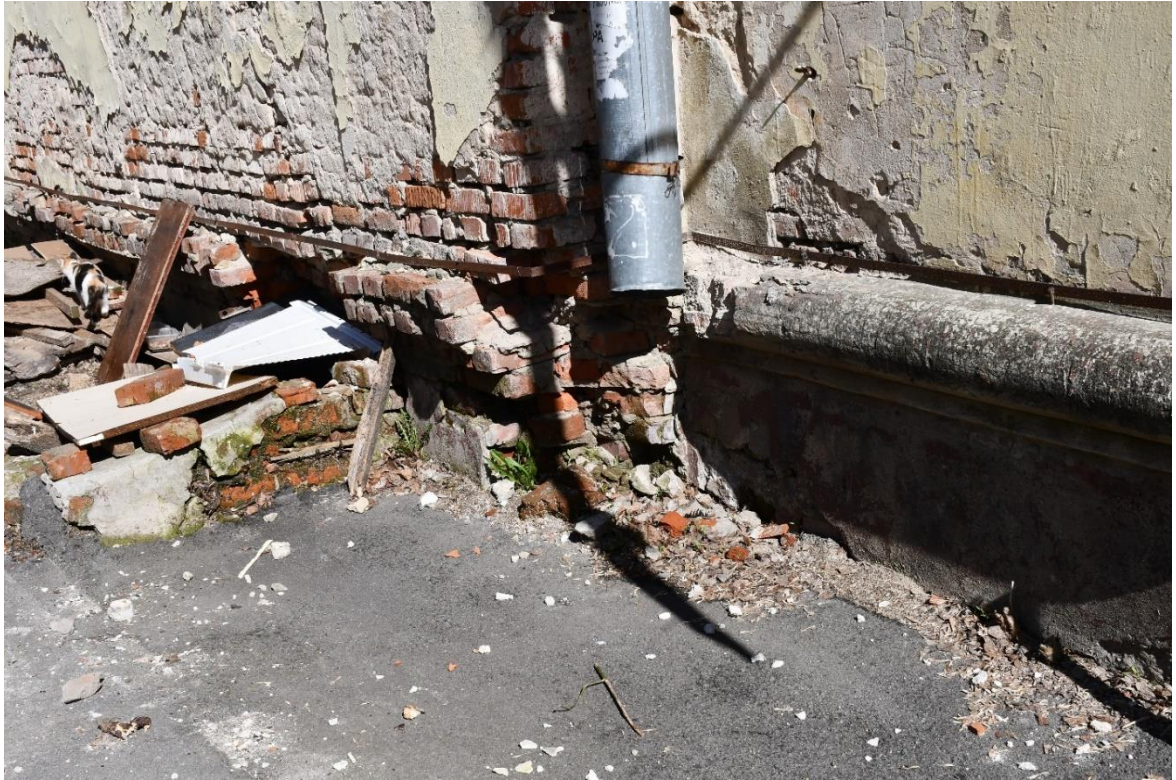
Фото 9. ОКН «Гостиница «Советская», 1960 г.». Фрагмент дворового фасада.

Увлажнение и следы биологического повреждения (мох, растительность) кирпичной кладки, наличие трещин, множественные утраты штукатурного слоя со стороны дворового фасада, отслоение отделочных слоев, вымывание и выветривание связующего раствора кладочных швов, деструкция кирпичной кладки и в местах утрат штукатурного слоя, разрушение и вывалы кладки цоколей дворового фасада, приямки разрушены, частично отсутствуют отметы (сливное колено).