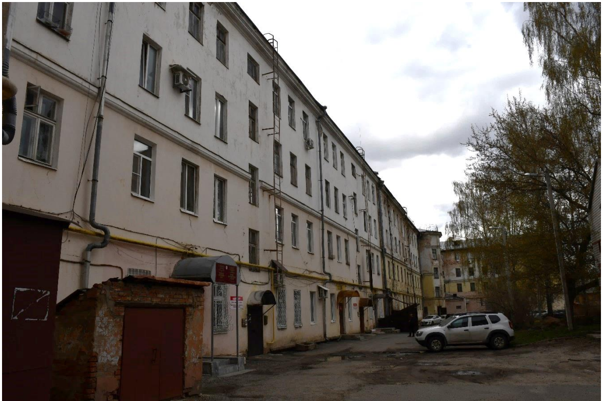
Фото 3. ОКН «Гостиница «Советская», 1960 г.». Фрагмент дворового фасада (вид с юго-запада). Неудовлетворительное состояние отделки фасадов.