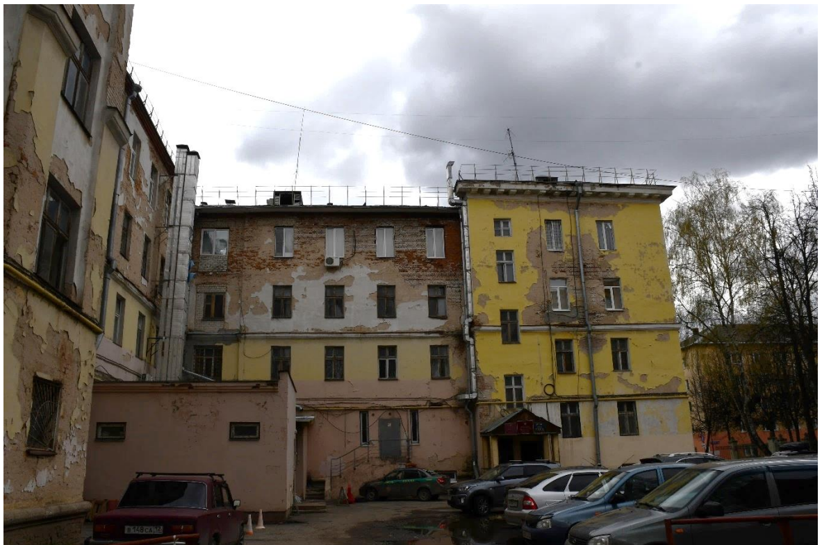
Фото 4. ОКН «Гостиница «Советская», 1960 г.». Фрагмент дворового фасада (вид с запада). Наличие вертикальных и наклонных трещин (поверхностные и сквозные) в стенах, множественные утраты штукатурного слоя, отслоение окрасочного слоя, заполнения оконных проемов частично заменены на пластиковые.