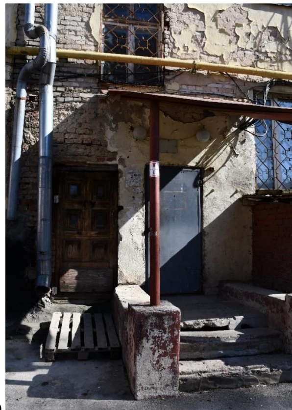
Фото 12. ОКН «Гостиница «Советская», 1960 г.». а) Фрагмент главного фасада, б) Фрагмент дворового фасада.

Неудовлетворительное состояние отделки фасадов, ступеней входной группы главного фасада, крылец дворового фасада.