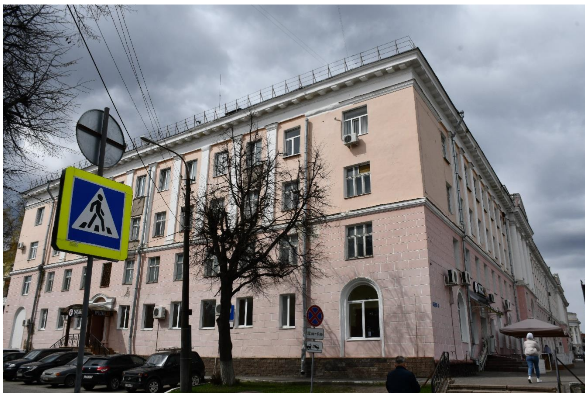
Фото 1. ОКН «Гостиница «Советская», 1960 г.». Вид на объект с ул. Волкова (вид с востока).

На фасадах установлены сплит-системы кондиционирования без согласования Минкультуры Республики Марий Эл, заполнения оконных проемов частично заменены на пластиковые, отсутствует информационная надпись объекта культурного наследия.