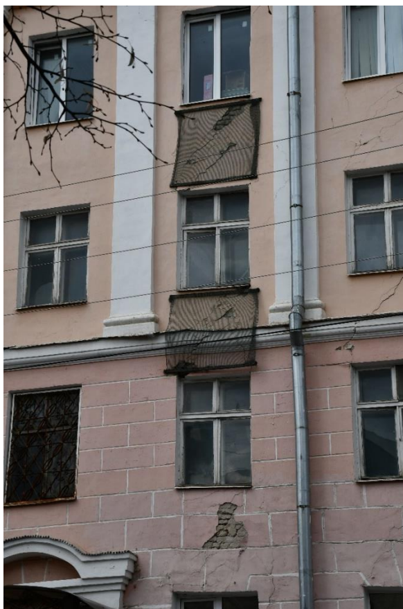
Фото 7. ОКН «Гостиница «Советская», 1960 г.». Фрагмент фасада по ул. Волкова (вид с востока). Наличие вертикальных и наклонных трещин (поверхностные и сквозные), утраты штукатурного слоя, множественные трещины в штукатурном слое, отслоение окрасочного слоя, неудовлетворительное состояние архитектурного декора.