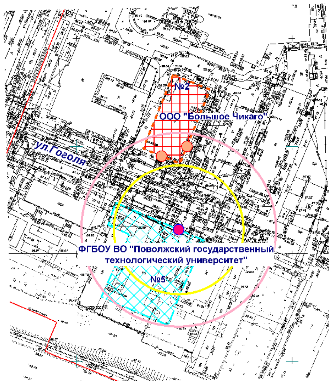
Схема границ прилегающих территорий