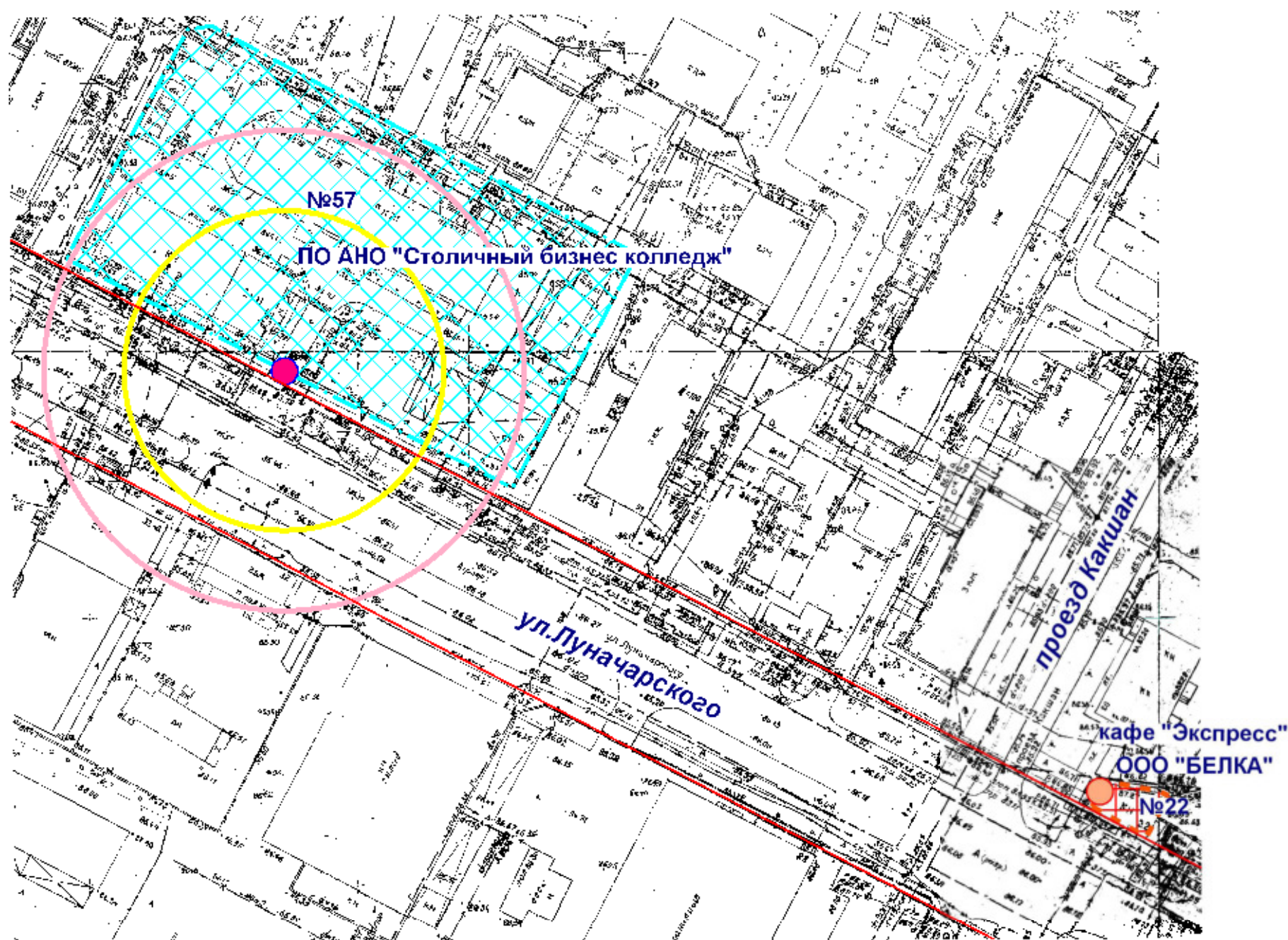
Схема границ прилегающих территорий