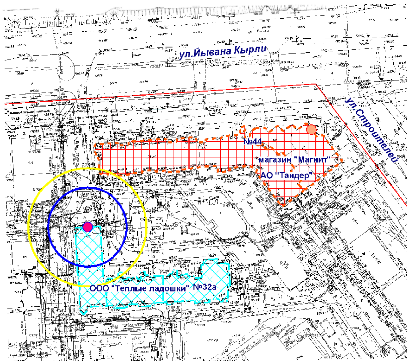
Схема границ прилегающих территорий