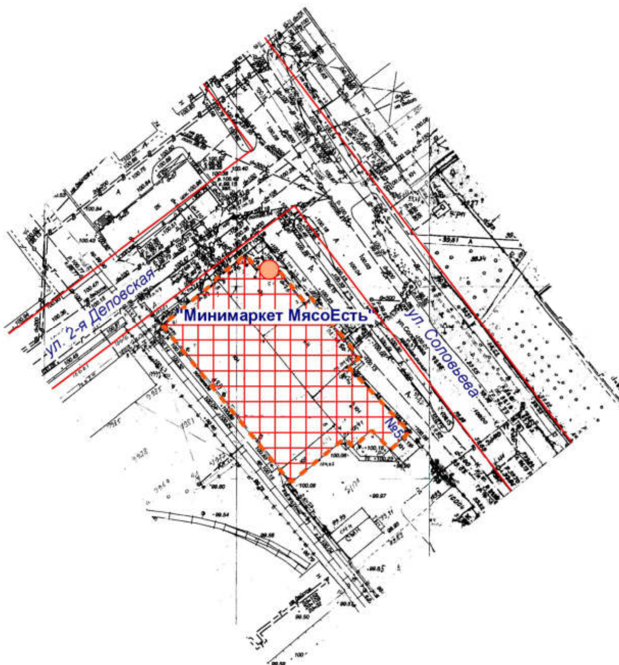
Схема границ прилегающих территорий