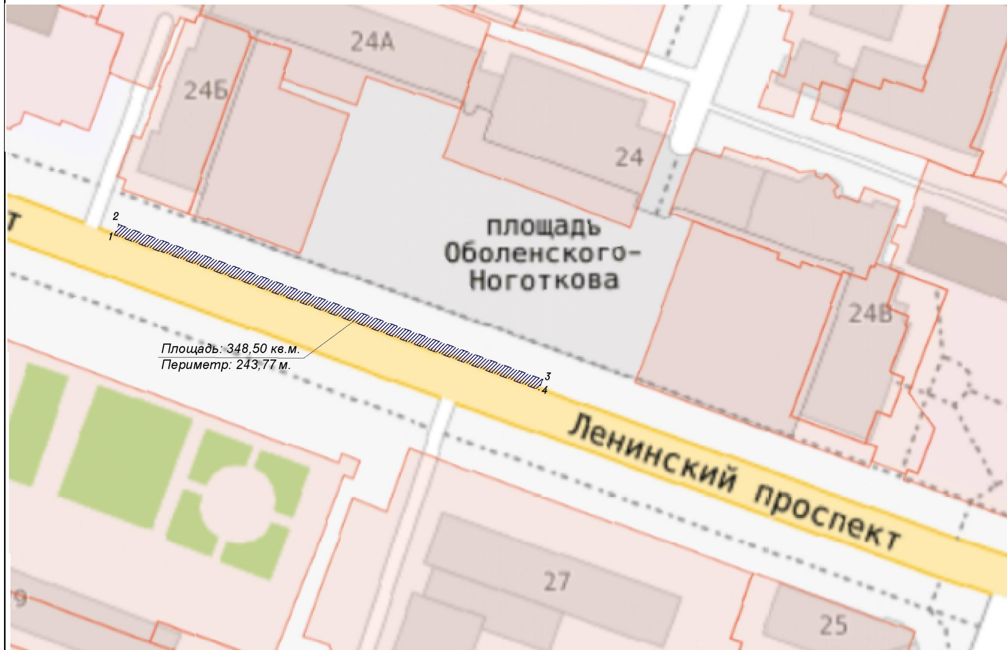
Схема расположения объекта (участка автомобильной дороги) на земельном участке на кадастровом плане территории