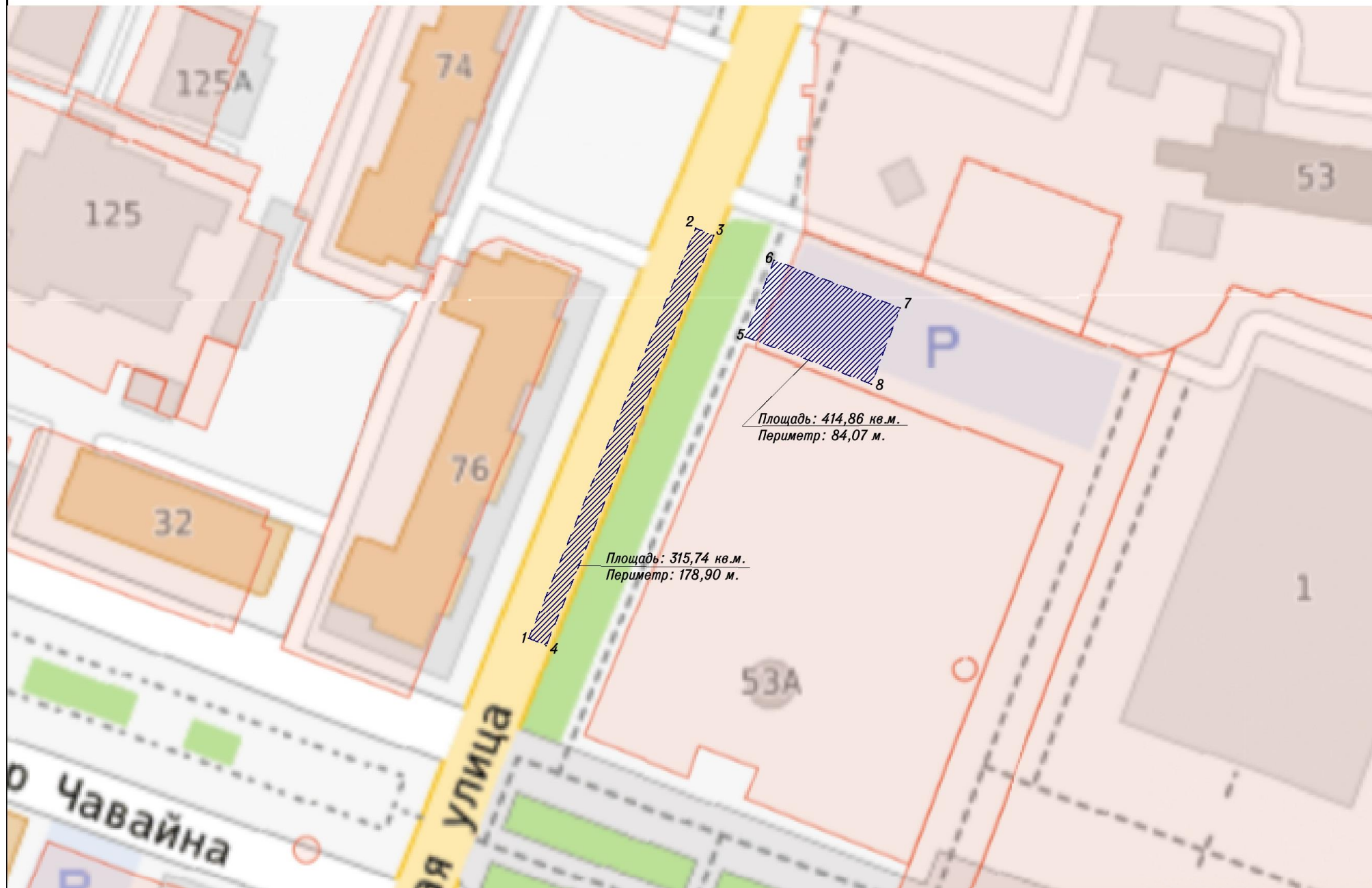
Схема расположения объекта (участка автомобильной дороги) на земельном участке на кадастровом плане территории