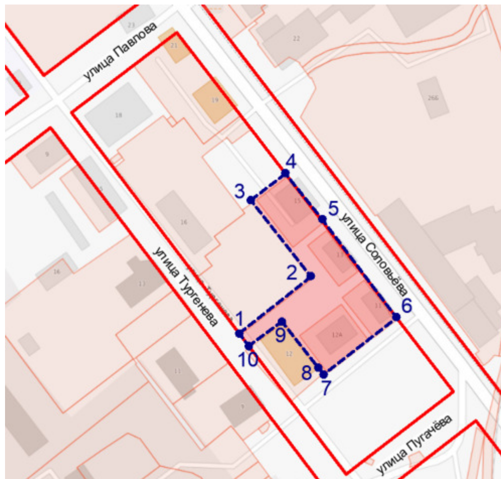
Схема границ территории № 1, подлежащей комплексному развитию

УТВЕРЖДЕНА постановлением администрации городского округа «Город Йошкар-Ола» от 26.09.2025 №1075